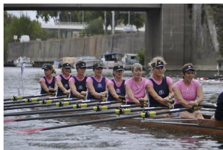
Bateau de Henley (club anglais)

Angers Nautique Aviron organise depuis 30 ans une compétition d'aviron, la « Coupe des Dames » dédiée au public féminin, associée à la « Coupe des Messieurs », disputée le lendemain. Ce sont plus de 500 rameuses et rameurs de loisir et/ou compétition, représentant d'une vingtaine de clubs français en majorité - mais des équipages étrangers participent depuis plusieurs années - qui viennent